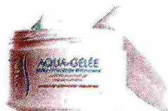
BIOThERM: Aqua Gelée Ultra Fresh (€ 23)