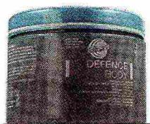
BIONIKE: Sculpt Fango alle 3 Argille (€ 38,50 in farmacia)